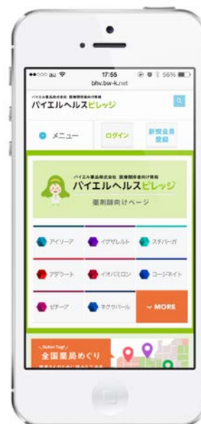
スマートフォンのトップページの一例